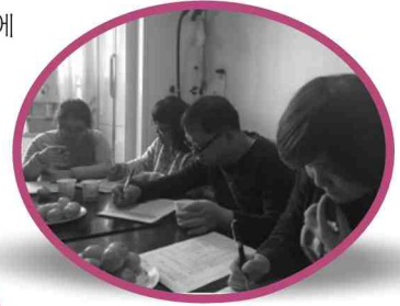
12/20 올리브하우스 송년회 및 자치회