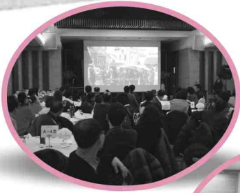
12/05 해인한 송년회-추억속으로