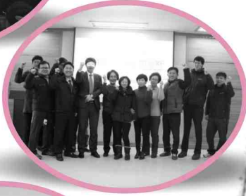
01/07 해인한 시무식