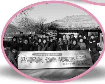
01/16~17 제1차 직원연수-충남아산 외암리 민속마을